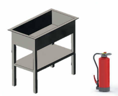
Metallwanne für Brandklasse F

Ein Feuerlöscher, der zum Beispiel das Rating 75 F erreichen soll, muss eine Wanne mit den Abmessungen 100 cm x 50 cm gefüllt mit 75 l Öl ablöschen.